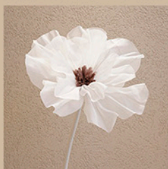
オーガンジーフラワー サイズ：約φ45cm