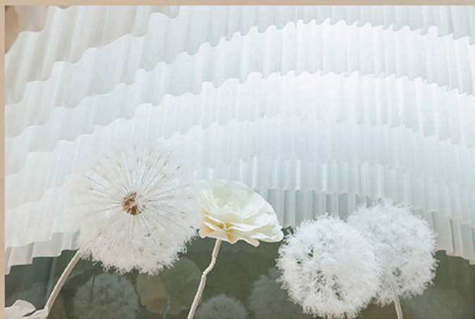
光を透かし、風に揺れる幕が幻想的な空間を演出します