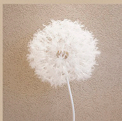
タンポポオブジェ サイズ：約φ45cm