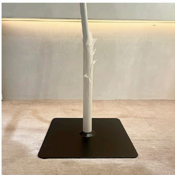
タンポポオブジェ オーガンジーフラワー ビッグソラフラワー ベース