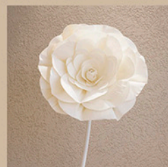
ビッグソラフラワー サイズ：約φ45cm