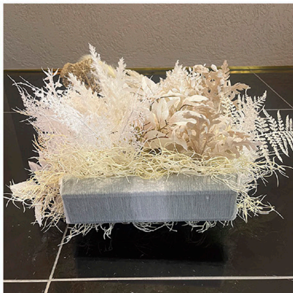
フラワーオブジェ (大) ベース 約 W26×D7×H3 cm