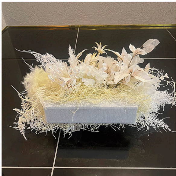
フラワーオブジェ (中) ベース 約 W26×D7×H3 cm