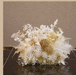
フラワーオブジェ(小) サイズ：約W50×D27×H32cm