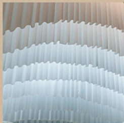
mirage ミラージュ 8層アーチ幕 サイズ：523×326cm

mirage 8層アーチ幕 1式/wave 天井13連幕 1式/フラワーオブジェ(アッシュ) 2個 フラワーオブジェ(大) 5個/フラワーオブジェ(中) 7個/フラワーオブジェ(小) 4個 タンポポオブジェ 6個/オーガンジーフラワー 9個/ビッグソラフラワー 3個