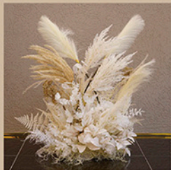
フラワーオブジェ(大) サイズ：約W50×D34×H70cm