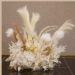
フラワーオブジェ(中) サイズ：約W50×D34×H53cm