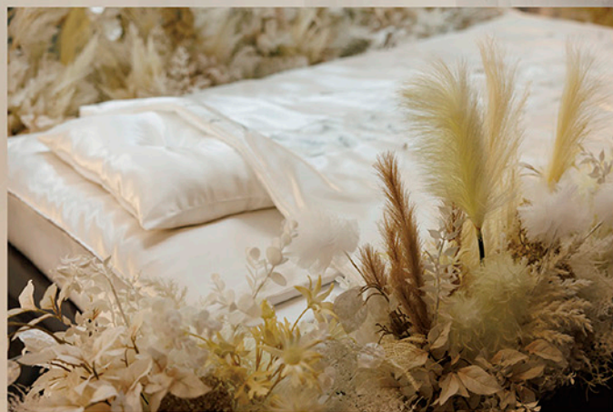
故人様を囲むナチュラルカラーの草花