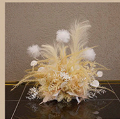
フラワーオブジェ (アッシュ) サイズ：約W50×D34×H50cm